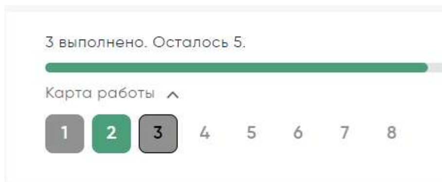
Рисунок 4. Карта работы

Если участник пропустил какой-то вопрос и хочет к нему вернуться, можно нажать кнопку «Назад» или выбрать номер пропущенного вопроса в карте работы. Вопрос, на который дан частичный ответ, на карте работы будет подсвечиваться серым цветом